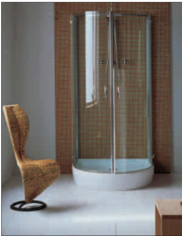
Stil betyder meget, når man skal sælge sin bolig. Det kan ikke betale sig at lave et badeværelse i en special stil, hvis man skal sælge sin bolig kort tid efter