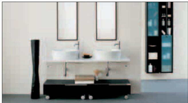
Flere badeværelser bliver større og får to håndvaske og to spejle, så man ikke skal stå i vejen for hinanden om morgenen.